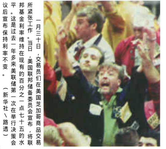
一月三十日，交易员们在美国芝加哥商品交易所紧张工作。当日，美联储在委员会宣布，将联邦基金利率维持在现有的百分之七点七十五的水平。这是过去一年多来美联储第一次在举行决策会议后宣布保持利率不变。（新华社路透）