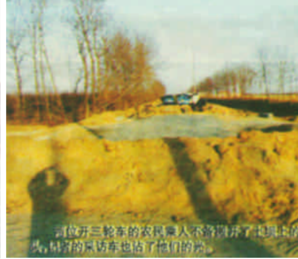
一位开三轮车的农民因不满浮桥收费，把路上的石头，堵住了进桥的车也堵了他们的路。

除提留款“提高占地费”等不同的要求，有关方面没有答复，于是他们便把路给堵了。有村民还自告奋勇回家拿来土地承包证，让记者看“三十年不变的合同”。村民还提出前几天薛家村村民薛某因事过河，与浮桥管理人员发生纠纷，“被打住院”。记者问浮桥是哪几家单位合建的，村民只说是镇上，其他不太清楚。