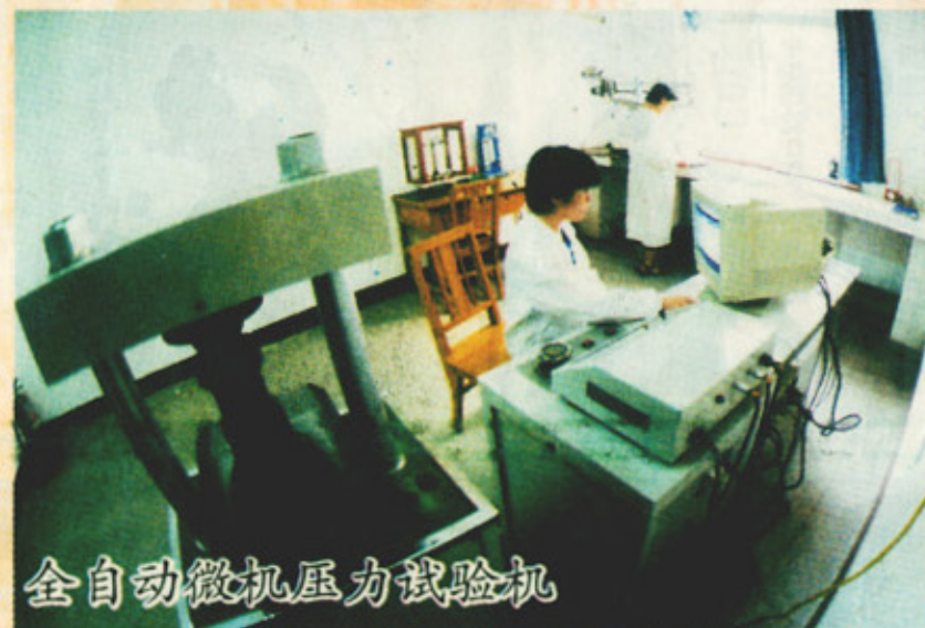
全自动微机压力试验机