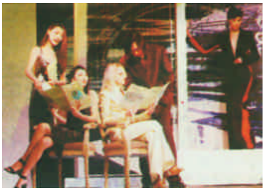
1月30日，济南“时尚房展会”上的模特们在演绎具有亲和力的居住环境。由济南新世界花园举办的这次“时尚房展会”，旨在提高和改善济南市民对房屋的鉴赏力和生活质量。