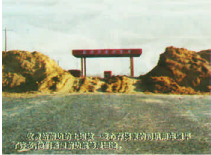
收管浮桥的土堆被一些心存侥幸的司机用来牟利，造成了安全隐患。

记者通过浮桥来到黄河北岸的售票亭，发现这里只有两位年轻的年轻人。他们以为我们要开车过去，便告诉我们前边路被堵住了，过不去。记者向他们询问有关情况，他们说不太清楚，最好到公司院内询问负责人。记者发现，就在北售票亭前边几米远的地方就有一条临时堆积起来的土堆，而不远处的浮桥有限公司大院从外边看起来也有点冷冷清清